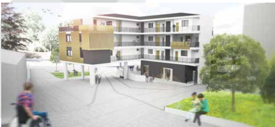
Aurreproiekturako LZB-k garatutako irudia.

Se impulsarán las compras, suscripciones y consumo de bienes colectivos.